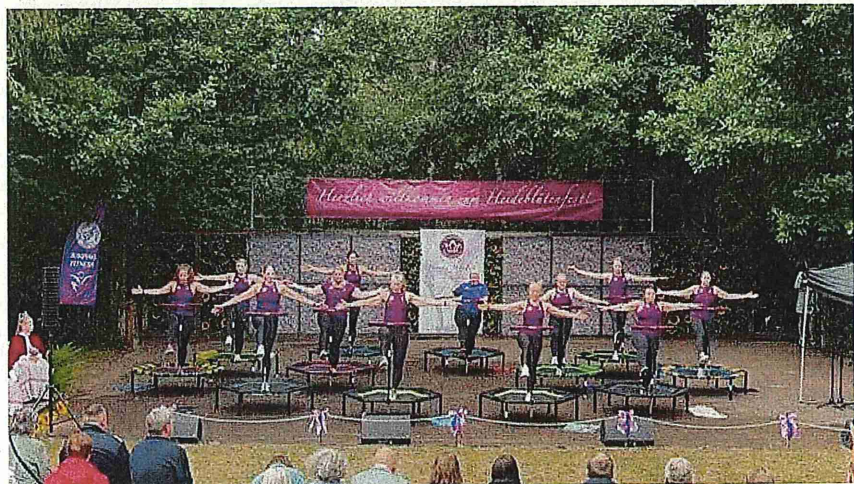
Auftrittsgruppe „Holle Jumper“