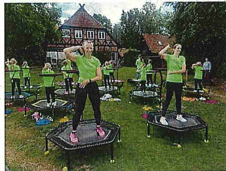
Auftrittsgruppe „Holle Raketen“